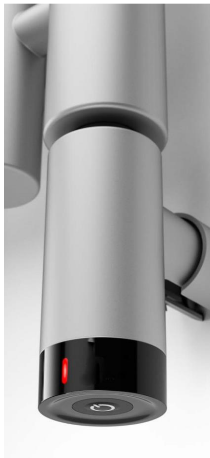
INDRA interruttore Scheda tecnica - Data sheet